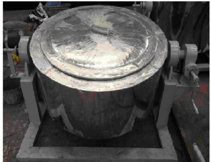
Ký hiệu: NN-0.2-3