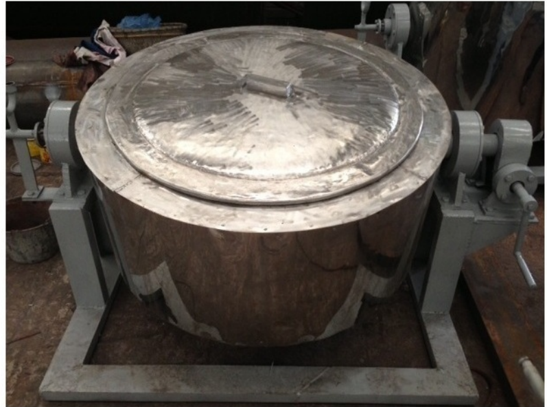
Ký hiệu: NN-0.1-3